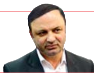
مدیرعامل سازمان منطقه آزاد انزلی در دیدار با هیات اقتصادی چین مطرح کرد:

برقراری پیوند آبی؛ ضرورت انکارناپذیر کشور