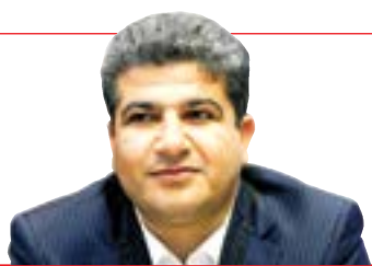
مدیرعامل سازمان منطقه آزاد چابهار بیان داشت:

برقراری پیوند آبی؛ ضرورت انکارناپذیر کشور