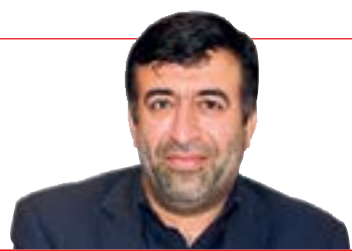
عضو موظف هیات مدیره سازمان منطقه آزاد قشم اظہار داشت: