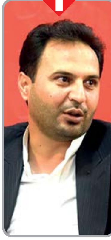
صفحه ۶ را بخوانید

بخش‌های دارای معافیت مالیاتی ویژه در مناطق آزاد مشخص شدند