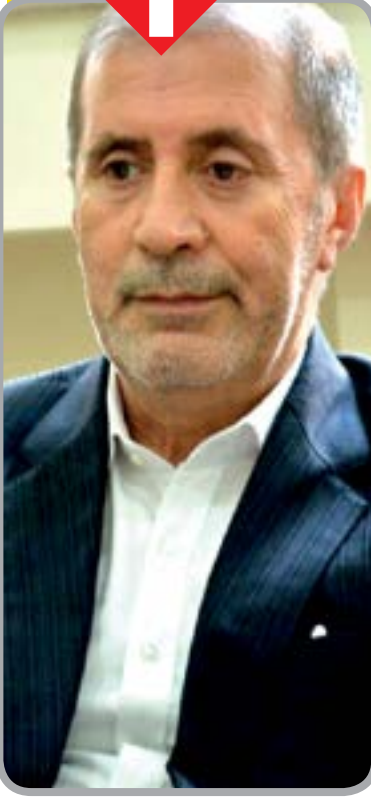
صفحه ۵ را بخوانید

نایب رئیس کمیسیون اقتصادی مجلس مطرح کرد: اجرای صحیح قانون چگونگی اداره منطقه آزاد اقتصادی-صنعتی ضرورت دارد