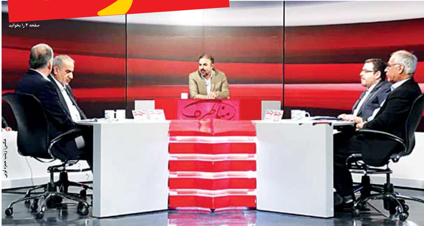
صفحه ۲ را بخوانید