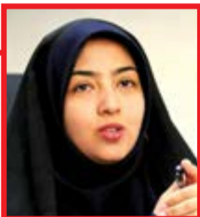
سعیدی مبارکه، سخنگوی کمیسیون اقتصادی مجلس:

نماینده مردم ماکو، چالدران، پلدشت و شوط در مجلس شورای اسلامی، تأکید کرد: قطعاً در این مسئله خبری وجود داشته، اما باید توجه کنیم که در شرایط فعلی که کشور در تحریم‌های ظالمانه آمریکا قرار گرفته، مناطق آزاد و ویژه اقتصادی که بیشتر هم در مناطق مرزی و محروم هستند، بتوانند هرچه بیشتر فعال شوند تا بتوانیم از ظرفیت این مناطق در جهت عبور از تحریم‌ها و موانع گام برداریم.