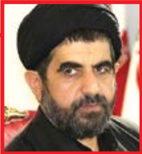
لارگانی، عضو کمیسیون اقتصادی مجلس شورای اسلامی: