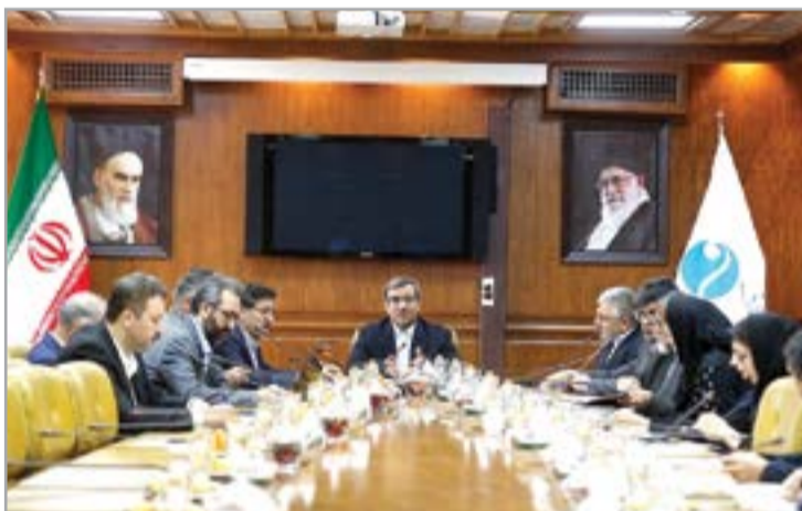
محمدرضا عبدی افزود: بر همین اساس سند راهبردی منطقه آزاد کیش که شامل

کار تدوین برنامه توسعه میان مدت سه ساله جزیره کیش در اولین نشست شورای راهبردی و مطالعات این جزیره آغاز شد.