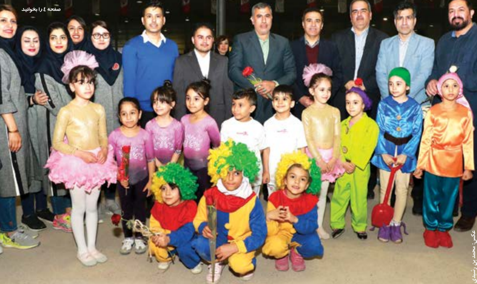
صفحه ۴ را بخوانید