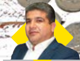
مدیرعامل سازمان منطقه آزاد چابهار: