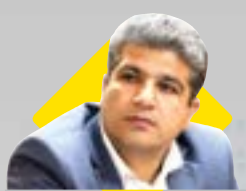
مدیرعامل سازمان منطقه آزاد چابهار اظهار کرد:

بالسازی و ساخت مدارس سیل زده، ماموریت سازمان منطقه آزاد چابهار