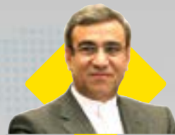
مدیرعامل سازمان منطقه آزاد کیشی تاکید کرد:

واگذاری زمین با کاربری تجاری در جزیره کیش انجام خواهد شد