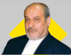
با حضور مدیرعامل سازمان منطقه آزاد قشم و استاندار کاسرسی اسپانیا:

تفاهم‌نامه همکاری میان ژئوپارک‌های قشم و اسپانیا به امضاء رسید