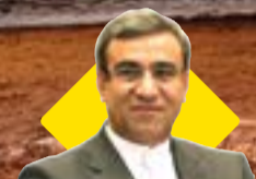
در دیدار دکتر مظفری با سفیر افغانستان در ایران مطرح شد:

علاقه مندی سرمایه گذاران و گردشگران افغانی جهت حضور در کیش