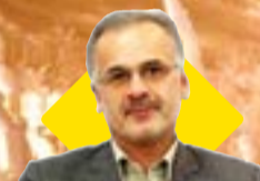
در دیدار دکتر روزبهان با رئیس دفتر رئیس جمهور عنوان شد:

منطقه آزاد انزلی برای هیات دولت از اهمیت خاصی برخوردار است