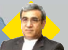
مدیرعامل سازمان منطقه آزاد کیش عشمان کرده

تبدیل تهدید کرونا به فرصتی برای پیشرفت در منطقه آزاد قشم