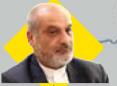
مدیرعامل سازمان منطقه آزاد قشم قشیم اظہار دانش

تبدیل تهدید کرونا به فرصتی برای پیشرفت در منطقه آزاد قشم