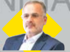
در دینکار مدیرعامل سازمان منطقه آزاد انزلی با رئیس سازمان پرنامه و پردهچه مطرح شد

میزبانی از رویدادهای بزرگ ورزشی جهان، یکی از ماموریت‌های مهم کیش