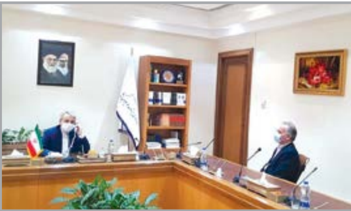
شهرک صنعتی شماره ۳ به منظور افزایش تولید و اشتغالزایی را از اهداف سازمان عنوان نمود.

رئیس هیات مدیره و مدیرعامل سازمان منطقه آزاد انزلی با دکتر محمدباقر نوبخت معاون رئیس‌جمهور و رئیس سازمان برنامه و بودجه کشور در دفتر کار ایشان دیدار کرد. دکتر محمدولی روزبهان در این دیدار، گزارشی از پیشرفت پروژه اتصال راه‌آهن به بندر کاسپین ارائه و بر عزم جدی سازمان متبوع خود در پیگیری از مراجع ذی‌ربط در افتتاح این پروژه تا پایان دولت دوازدهم تاکید نمود.