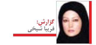
گزارش: فریبا شیخی

در ماده ۱۱ به مناطق آزاد اجازه داده شده که در ازای خدمات، به فعالین مجوز دهند؛ یعنی اصلی‌ترین کاری که شروع فعالیت اقتصادی در مناطق آزاد است؛ به عبارتی، مناطق آزاد برای کلیه فعالیت‌های مجاز در محدوده خود می‌توانند مجوز صادر کنند و دیگر