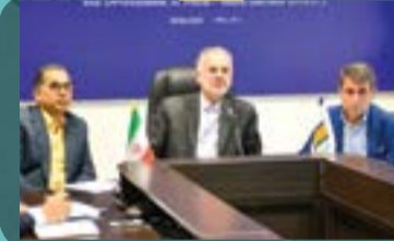
با حضور نمایندگان کشور عضو کارگروه بین‌المللی کریدور شمال-جنوب انجام شد:

پروژه ترمینال جدید فرودگاه کیش، الگویی از کیفیت و سرعت انجام کار در کشور