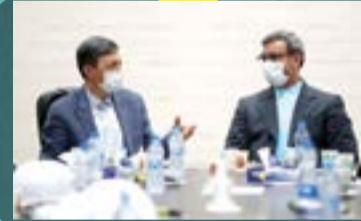
در نشست مدیرعامل سازمان منطقه آزاد کیش با رئیس بنیاد مستضعفان عنوان شد:

پروژه ترمینال جدید فرودگاه کیش، الگویی از کیفیت و سرعت انجام کار در کشور