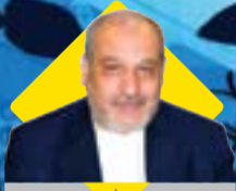
مدیر عامل سازمان منطقه آزاد قشم در دیدار با خبرنگاران مطرح کرد:

بهربرداری از ۹۹ پروژه با اعتبار ۳۱۰ هزار میلیارد ریال تا ۱۴۰۰ در قشم