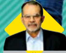
مدیر عامل سازمان منطقه آزاد اروند در مراسم روز خبرنگار اظهار داشت:

گسترش فعالیت‌های واحد بین‌الملل دانشگاه آزاد انزلی با الگوهای عملی همکاری