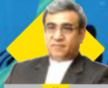
مدیر عامل سازمان منطقه آزاد کیش اظهار داشت:

بهربرداری از ۹۹ پروژه با اعتبار ۳۱۰ هزار میلیارد ریال تا ۱۴۰۰ در قشم