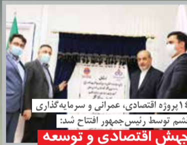
۱۴ پروژه اقتصادی، عمرانی و سرمایه‌گذاری قشم توسط رئیس‌جمهور افتتاح شد: