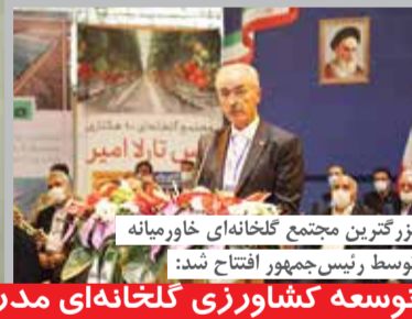
بزرگترین مجتمع گلخانه‌ای خاورمیانه توسط رئیس‌جمهور افتتاح شد: