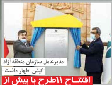
مدیرعامل سازمان منطقه آزاد کیش اظهار داشت: