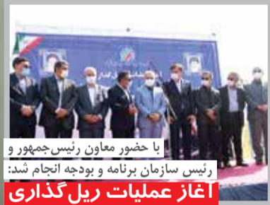
با حضور معاون رئیس‌جمهور و رئیس سازمان برنامه و بودجه انجام شد: