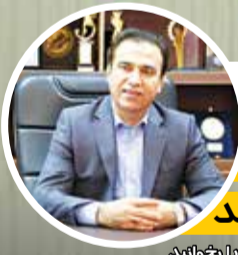
معاون سرمایه‌گذاری و توسعه کسب و کار سازمان منطقه آزاد اروند اظهار داشت: