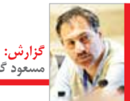
گزارش: مسعود کادار