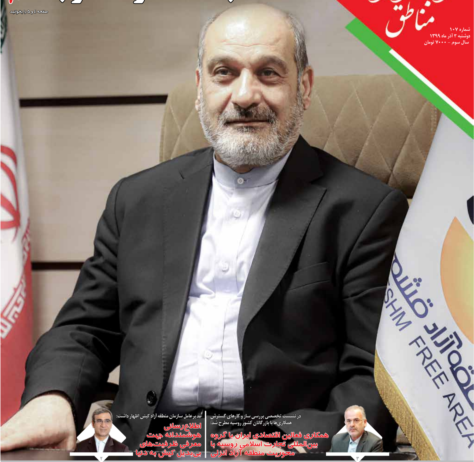
مدیرعامل سازمان منطقه آزاد کیش اظهار داشت:

اطلاع‌رسانی هوشمندانه جهت معرفی ظرفیت‌های بی‌بدیل کیش به دنیا