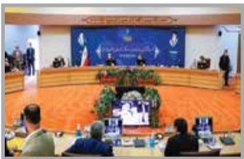
رئیس سازمان پدافند غیرعامل کشور برگزار شد و از مدیران و معاونین برتر وزارتخانه‌ها و سازمان‌ها تقدیر به عمل آمد.

نشست ملی پدافند غیرعامل به ریاست «عبدالرضا رحمانی فضلی» وزیر کشور و با حضور سردار «محمدحسین باقری» رئیس ستاد کل نیروهای مسلح و سردار «غلامرضا جلالی»