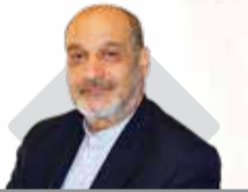
مدیرعامل سازمان منطقه آزاد قشم اظهار داشت:

آماده سازی بستر و مسیر جهت حضور سرمایه گذاران در منطقه آزاد قشم