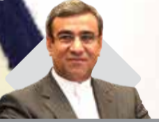
مدیرعامل سازمان منطقه آزاد کیش تاکید کرد:

آماده سازی بستر و مسیر جهت حضور سرمایه گذاران در منطقه آزاد قشم