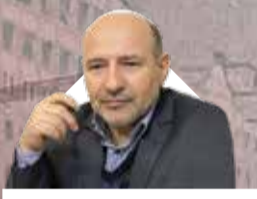
سرپرست سازمان منطقه آزاد اروند اظهار داشت:

شفافیت رکن اصلی سازمان منطقه آزاد قشم در راستای خدمت به مردم