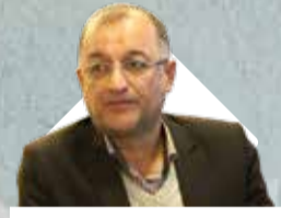
مدیرعامل سازمان منطقه آزاد کیش اظهار داشت:

منطقه آزاد انزلی فرصت جدی تحول اقتصادی در سطح کشور و حوزه بین‌الملل