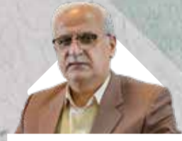
مدیرعامل سازمان منطقه آزاد انزلی اظهار داشت:

تحقق جذب سرمایه‌گذاری با توسعه زیرساخت‌های آموزشی در اروند