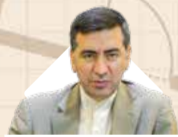
مدیرعامل سازمان منطقه آزاد قشم در مراسم امضاء تفاهت‌نامه همکاری با بانک سینا اظہار داشت:

توسعه تعاملات بانکی در جهت تامین اعتبارات مورد نیاز فعالان اقتصادی قشم