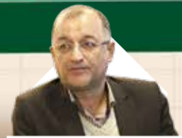
مدیرعامل سازمان منطقه آزاد کیش گفت:

تبدیل منطقه آزاد انزلی به هاب داد و ستد کالاهای اساسی و تجاری کشور