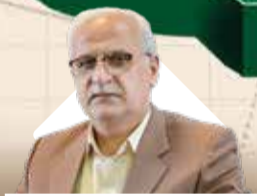
مدیرعامل سازمان منطقه آزاد انزلی اظہار داشت:

نقش آفرینی منطقه آزاد اروند در جهت تسهیل‌گری و رفع موانع فعالین اقتصادی