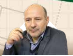
سرپرست سازمان منطقه آزاد اروند اظہار داشت:

توسعه تعاملات بانکی در جهت تامین اعتبارات مورد نیاز فعالان اقتصادی قشم