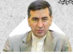
مدیرعامل سازمان منطقه آزاد قشم اظهار داشت:

از توسعه سرمایه‌گذاری تا موفقیت در حوزه گردشگری منطقه آزاد اروند