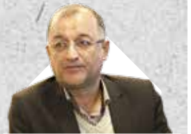
مدیرعامل سازمان منطقه آزاد کیش تصریح کرد:

ضرورت اجرای طرح‌های نوآورانه با پشتوانه علمی در جزیره کیش