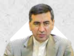
مدیرعامل سازمان منطقه آزاد قشم اظهار داشت:

حرکت پرشتاب منطقه آزاد قشم بر مدار توسعه و جهش تولید