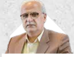
مدیرعامل سازمان منطقه آزاد انزلی اظهار کرد:

جزیره کیش الگویی نمونه در جهت حکمروایی موثر محلی