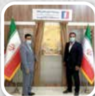
معاونی فنی و امور زیربنایی سازمان منطقه آزاد اروند اظهار داشت:

بهربرداری از ۴ طرح تولیدی، خدماتی و زیرساخت بندری در منطقه آزاد انزلی