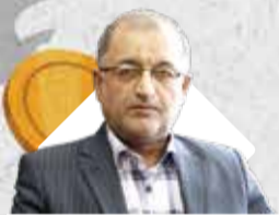
مدیرعامل سازمان منطقه آزاد کیش بیان داشت:

حرکت پرشتاب منطقه آزاد قشم بر مدار توسعه و جهش تولید