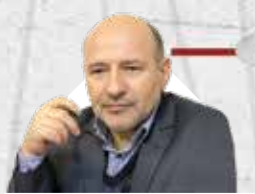
سرپرست سازمان منطقه آزاد اروند تصریح کرد:

یکپارچگی کارکردی، رکن اصلی جهت تبدیل قشم به نخستین مقصد گردشگری کشور