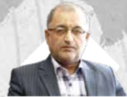
مدیرعامل سازمان منطقه آزاد کیش اظهار داشت:

تبدیل منطقه آزاد انزلی به هاب ترانزیتی کالا در منطقه اوراسیا