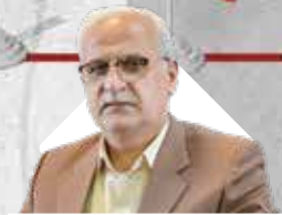
در دیدار معاون گمرکات کشور با مدیرعامل سازمان منطقه آزاد انزلی مطرح شد:

لازم‌الاجرا بودن مصوبات کارگروه تسهیل و رفع موانع تولید منطقه آزاد اروند