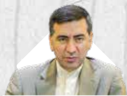
مدیرعامل سازمان منطقه آزاد قشم اظهار داشت:

یکپارچگی کارکردی، رکن اصلی جهت تبدیل قشم به نخستین مقصد گردشگری کشور