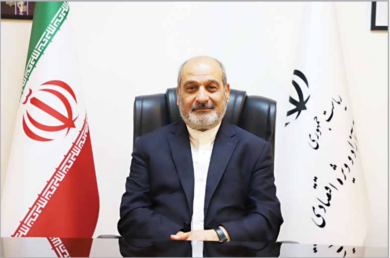
هشت منطقه جدید است، باید به موارد ذیل اشاره کرد. در مناطق

ازد ویژه زمینی می‌توان از منطقه آزاد قشم مثل زاد که از ظرفیت‌های بسیار خوبی در حوزه گردشگری برخوردار می‌باشد، با توجه به صورت موردی اگر بررسی شود باید گفت که در چاپلر دولتی دو دوره دولت گذشته از طریق ایجاد زیرساخت‌های متنوع و فراوانی برخوردار بوده و در این زمینه‌ها فعالیت می‌کند. در کیش، قرار به تبدیل‌شدن به صنایع پشتیبانی صنایع نفت و گاز، گردشگری و خدمات نیز در بخش‌های نفت، گاز، و پتروشیمی هدفگذاری شده بود. مهم‌ترین چالش سه منطقه نسل اول، نبود زیرساخت‌های اولیه بود؛ معضلی که نسل‌های بعدی آرام آرام در مسیر رفق آن می‌باشند، موجود از مناطق آزاد گفته‌اند. در حوزه‌های نفت، گاز، گردشگری و پتروشیمی و بانکینگ فعالیت‌های خود را آغاز کرده، که می‌توان به ۲۵هزار بشکای دیگر و اجرای طرح‌های سرمایه‌گذاری به منظور تبدیل‌شده به هدف پتروشیمی و امور ششلاتی و گردشگری اشاره کرد. در منطقه آزاد چاپلر اقدامات بسیار خوبی در حوزه راحتی عبور کرد. از سوی دیگر درباره نحوه‌الداری منطقه نیز مسائلی وجود دارد که می‌توان به منخالات سازمان‌های عامل در امور اجرایی اشاره قانونی و بهره‌مندی زیرساخت، ساختار صورت تأکید قلمداد می‌شود، وجود طرح جامع صوبیه و ابلاغی است تا برنامه‌ها و فعالیت‌ها در چارچوب آن طرح جامع صورت گیرد.