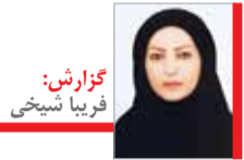
گزارش: فربیا شیخی

مناطق آزاد، ظرفیت‌های استراتژیک اقتصاد کشور هستند که می‌توانند تاثیر بسزایی در دوران تحریم و شرایط سخت اقتصادی داشته باشند؛ مناطقی که با ایجاد بسترهای زیرساختی کلان و نیز تعامل نسبی با کشورهای همجوار می‌توانند به مانند یک موتور محرک در مسیر کاهش تاثیر تحریم‌ها بر بدنه اقتصاد کشور، نقشی سازنده داشته باشند. بی‌شک جهش تولید و به تبع آن توسعه نگاه تولیدات صادراتمحور، یکی از مهم‌ترین پیشران‌های توسعه مناطق آزاد است که نیاز به توجه و عظم ملی در رسیدن به این هدف دارد. سال ۱۴۰۰، سال فرصت‌ها، امکانات و گشایش‌های اقتصادی در مناطق آزاد و ویژه اقتصادی از طریق تبدیل پتانسیل‌های درون‌زای اقتصادی به ظرفیت‌سازی‌ها و اخذ نوآوری‌های فناورانه و تعامل با اقتصاد کشورهای پیرامونی است.