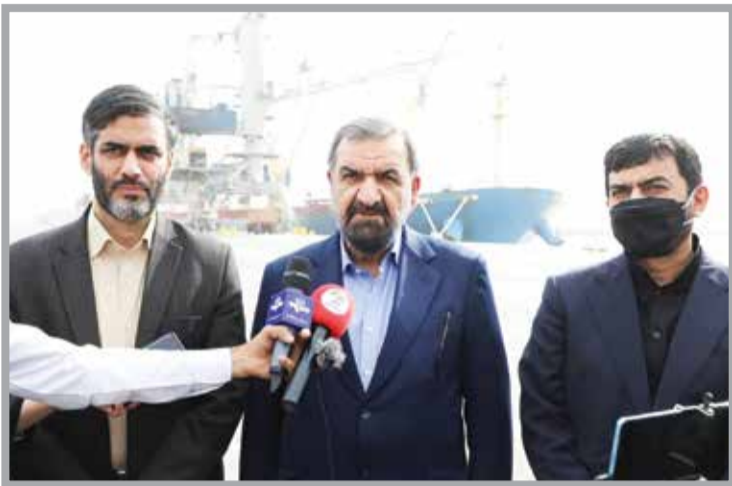
بیشتری، کالا‌های وارداتی را خریداری کنند. تکمیل راه‌آهن جنوب به شمال؛ تحقق رویای ۲۰۰ ساله

رضایی درخصوص راه‌آهن چابهار-زاهدان گفت: یکی از مشکلات اصلی کشور این بوده که کارها اولویت‌بندی نمی‌شده است و درواقع یک پول سالانه‌ای را به سراسر هزینه‌ها توزیع می‌کنیم و برخی از امورات اقتصادی که باید سرپا به بهره‌برداری برسد و آثار خود را در اقتصاد ملی نشان دهد، با سال‌ها تأخیر مواجه می‌شود.