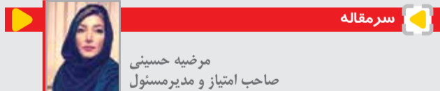
سر مقاله صاحب امتیاز و مدیرمسئول مرضیه حسینی

البته امروز برای مقابله با شرک مدرک‌داران بی‌درک، بسیار دیر شده است؛ زیرا