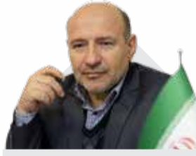
مدیرعامل سازمان منطقه آزاد ماکو تصریح کرد:

توسعه دیپلماسی اقتصادی در راستای افزایش صادرات و جهش سرمایه‌گذاری در قشم