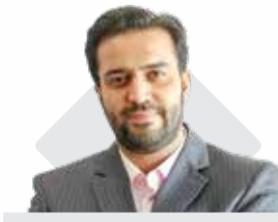
مدیرعامل سازمان منطقه آزاد کیش اظهار داشت:

راه‌اندازی منطقه آزاد مشترک در دستور کار سازمان منطقه آزاد ماکو