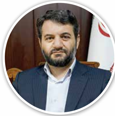
صفحه ۸ | رای‌پخش

مشاور رئیس‌جمهور و دبیر شورایی عالی مناطق آزاد و ویژه اقتصادی مطرح کرد: پرونگری و تامین منابع ارزی، مأموریت اصلی مناطق آزاد در دولت سیزدهم