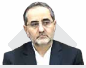
مدیرعامل سازمان منطقه آزاد قشم اظهار داشت:

توسعه دیپلماسی اقتصادی در راستای افزایش صادرات و جهش سرمایه‌گذاری در قشم